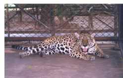
Otorongo Parque Natural y Museo Jimdatas.tripod.com.pe

Creado para proteger y conservar diversas especies de flora y fauna silvestres como monos, lagartos, otorongos, venados, sajinos, añujes, nutrias, taricayas,