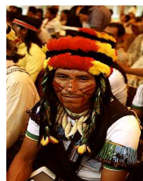
Nativo de Sharpa Promperu

Con el auge del caucho y su gran demanda en el mercado internacional entre 1883 y 1914, la presencia de población occidental se hizo cada vez más fuerte, pero la explotación cauchera no implicó la incorporación de los grupos nativos a la estructura económica, política y social del Perú republicano.