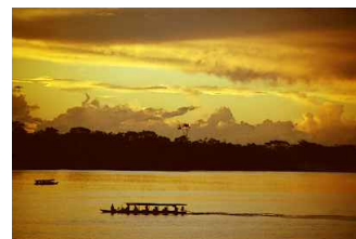
Atardecer en la Laguna de Yarinacocha

52 Sloane Street, SW1X 9SP Telfs. +44 020 7838 9223 +44 079 2188 6202 (emergencia) Fax: +44 020 7823 2789 e-mail: peruconsulate-uk@btconnect.com consejodeconsultaenlondres@hotmail.com webside: www.conperlondres.com